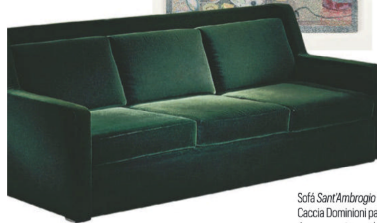
Sofá Sant'Ambrogio de Caccia Dominioni para Azucena y pintura de Cynthia Talmadge.